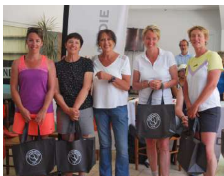
L'équipe de l'AS Rouen UC