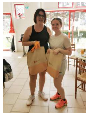
L'équipe de Condé sur Noireau