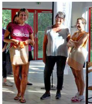
L'équipe du club de Lessay

Vu le succès de cette première édition, la Commission renouvellera cette compétition pour 2023 et a décidé de créer un second championnat de doubles féminin pour les équipes dont le poids de double sera de 14 et +.