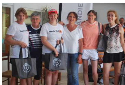
L'équipe de Caen TC