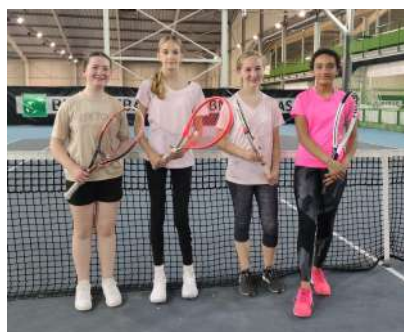
L'équipe de Pacy-sur-Eure

L'équipe de Pacy-sur-Eure a représenté la Normandie pour la finale nationale à Dinard les 18 et 19 juin. Nos jeunes normandes n'ont pas démerité et ont terminé à la 8 ème place sur 16.