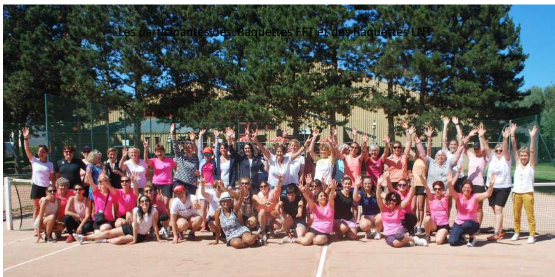
Les équipes des Raquettes FFT et des Raquettes LNT

Le 12 juin à Honfleur, c'est dans une ambiance très conviviale que les équipes de l'AS Rouen UC et du TC Caen ont obtenu leur qualification pour la finale nationale.