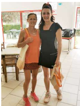
L'équipe de Bieville Beuville