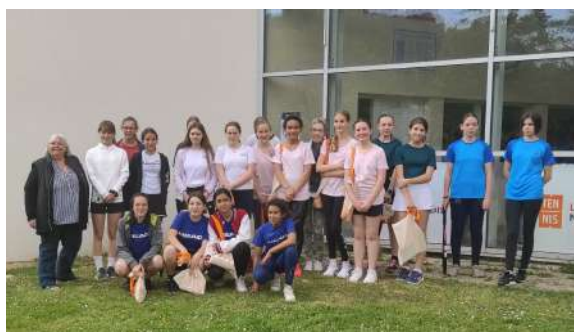
Les équipes Raquettes Ados FFT

Le 7 mai, les jeunes joueuses se sont retrouvées à Honfleur et après une finale très disputée et riche en émotion, l'équipe de Pacy-sur-Eure l'a emporté sur celle de Saint-Aubin.